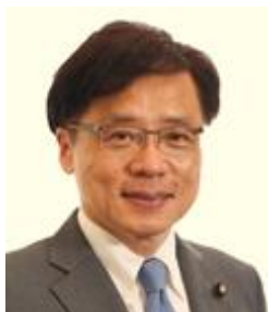
井上さとし 参議院議員