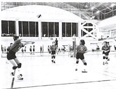
▲ 6月開催の南知多町体育大会

勤勉手当は、国県近隣市町の動向を注視し、条例・規則の改正をしていく。今年度からの支給は考えていない。昇給については正規職員とのバランスを考慮し、検討していく。